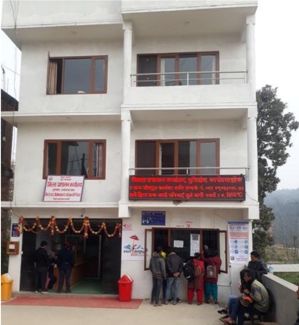
जिल्ला प्रशासन कार्यालय, काभ्रेपलान्चोक

स्थानीय प्रशासन ऐन, २०२८ बमोजिम काभ्रेपलान्चोक जिल्लाको शान्ति सुरक्षा अमनचयन कायम गर्न तथा जिल्लास्थित अन्य कार्यालयहरूसँग समन्वयकारी भूमिका निर्वाह गर्दै विकास तथा सुशासन कायम गर्ने जिम्मेवारीका साथ वि.सं. २०२८ सालमा जिल्ला प्रशासन कार्यालय स्थापना भएको हो । यस कार्यालयले नेपाल सरकार कार्यविभाजन नियमावली, २०७४ले निर्दिष्ट गरेको गृह प्रशासनको अधिकार क्षेत्र भित्र रहेर काम गर्दै आएको छ । यस कार्यालयले मुख्य रूपमा संघ, प्रदेश र स्थानीय तहहरू बीच समन्वय र सुरक्षा प्रबन्ध, अपराध रोकथाम तथा नियन्त्रण, दैनिक रूपमा नियमानुसार नागरिकता तथा राहदानी वितरण, हातहतियार तथा खरखजाना, सार्वजनिक सम्पत्तिको संरक्षण, जुवाजन्य क्रियाकलापको नियन्त्रण, लागुऔषध नियन्त्रण, विपद् व्यवस्थापन, सीमा सुरक्षा, अत्यावश्यक वस्तु तथा सेवाको आपूर्ति तथा बजार अनुगमन, सरकारी सवारी साधनको समुचित प्रयोगको व्यवस्था मिलाउने र अन्य आकस्मिक सम्पूर्ण कार्यहरू सम्पादन गर्दै आएको छ ।